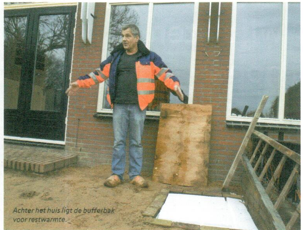
Achter het huis ligt de bufferbak voor restwarmte.