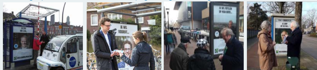
Wethouders van Zwolle, Venray, Huizen Leeuwarden (vlnr) gaan in gesprek met hun inwoners over klimaatverandering

In veel gemeenten gingen de wethouders in aanloop naar de verkiezingen de straat op om met hun inwoners in gesprek over de genomen en de te nemen maatregelen om klimaatverandering te stoppen. Lokale media plaatsten vooraankondigingen en verslagen van de gesprekken, en zo had de campagne nog een veel groter bereik.