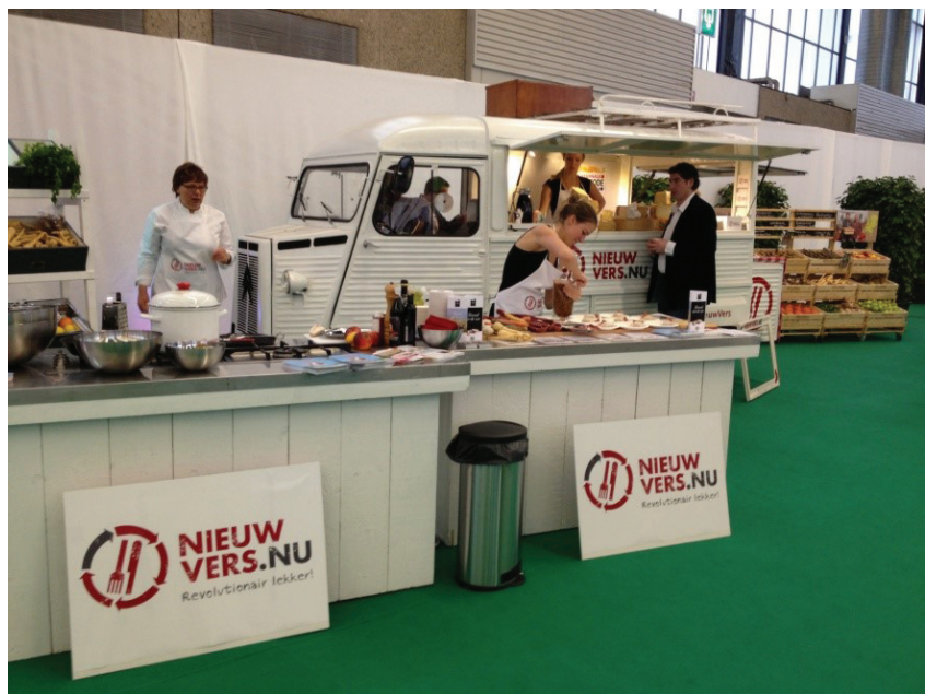
Urgenda met foodtruck op de Horecava

Een van de manieren om het voedselsysteem verder te verduurzamen, is het steunen van koploperproducenten en andere initiatieven die bijdragen aan het sneller verduurzamen van ons voedselsysteem. De steun varieert van het organiseren van proeverijen, het mee helpen zoeken naar fondsen of andere financiering, lobbyen, een platform bieden op een beurs tot het genereren van publiciteit. Een greep uit de ondernemers met wie wij samenwerkten in 2012: Meatless, Pure Graze, De Vegetarische Slager, Willem & Drees, het lupinevarken, Pura Natura, de Dutch Weed Burger, de Natuurhoeve.