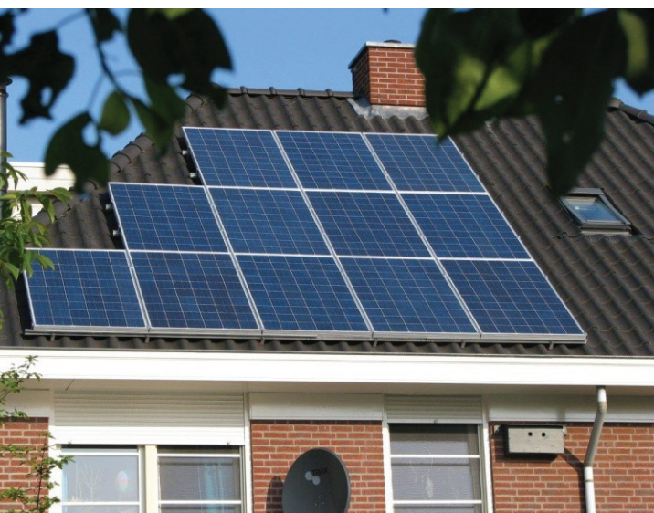
Steeds meer zonnepanelen op Nederlandse daken.

Om de aanschaf van zonnepanelen stevig te stimuleren is op Vlieland ook met een promotiecampagne gestart. Hier werken we hard om het sportcentrum en zwembad Flidunen als grote energieverbruiker flink te verduurzamen.