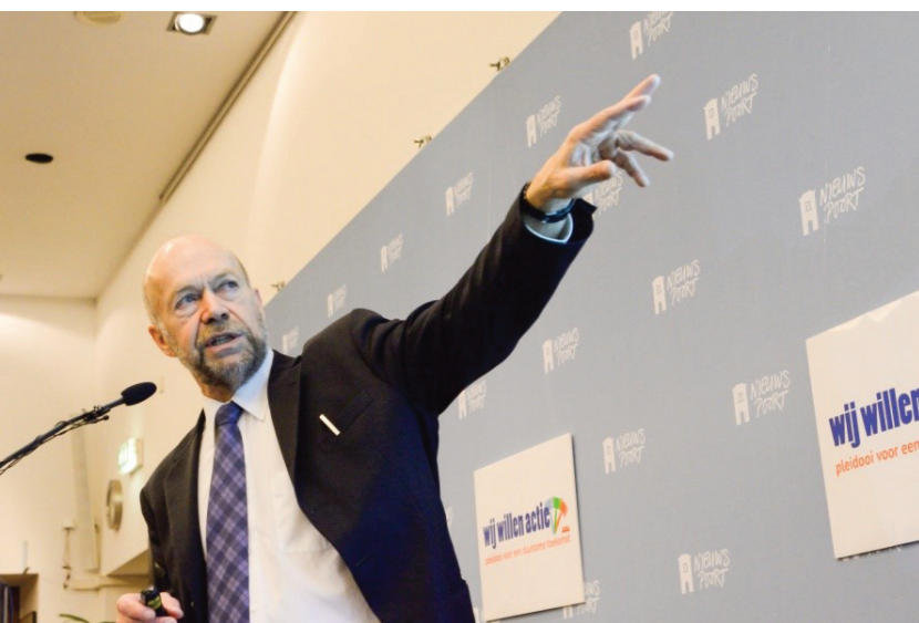
Start juridische actie met James Hansen

Klimaatverandering is niet te stoppen als de overheid niet meewerkt aan een transitie naar een samenleving op duurzame energie in 2030. We hebben ook de medewerking van particulieren en bedrijven nodig, maar dat is niet voldoende. De overheid kan helpen versnellen en de urgentie op de kaart zetten. Dat kan door concreet en gericht beleid en ondersteunende wet- en regelgeving. Daarnaast zal de overheid alle andere partijen in de samenleving aan moeten zetten of moeten verleiden meer te doen. Daarom startte Urgenda op 14 november 2012 in aanwezigheid van onder meer