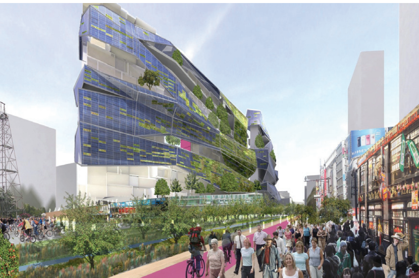
TU/e City of Tomorrow

Met ideeën hoe dit uitgewerkt kan worden voor het onderzoek en voor het onderwijs heeft Campus 2020, een internationaal vermaarde broedplaats voor duurzame innovaties, gereflecteerd op de toekomst. Het onderzoek en interdisciplinaire onderwijs op de drie Strategic Areas, worden zichtbaar toegepast en in de praktijk getest op en rond de campus in spraakmakende kringlopen. Dit gebeurt op een wervende en aantrekkelijke manier, met gerichte publiciteit, waardoor nieuwe groepen studenten worden aangetrokken. De TU/e toont hoe de toekomst eruit ziet. Daar verrijst de City of Tomorrow, waar de studenten van heinde en ver naartoe zullen komen om mee te werken, in onderzoek- en onderwijsprojecten. De leidende visie is het ontwerpen vanuit circulair denken: het sluiten van fysieke kringlopen, hergebruik van kennis en gebruik van hernieuwbare energiebronnen, gebaseerd op diversiteit. In deze visie staan de thema's Energy, Smart Mobility en Health centraal.