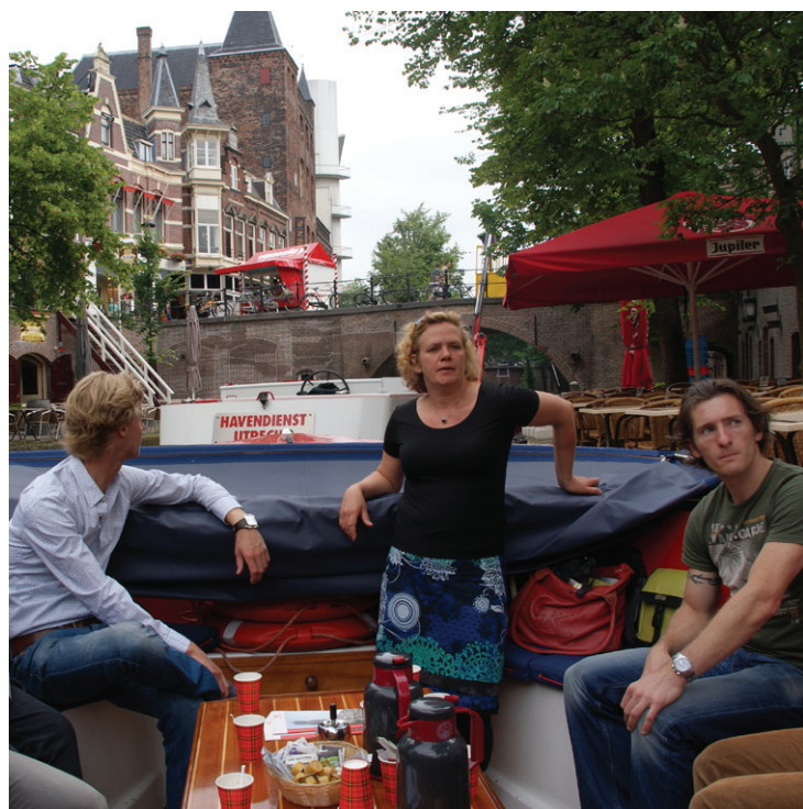
Urgendam medewerkers op elektrische bierboot.