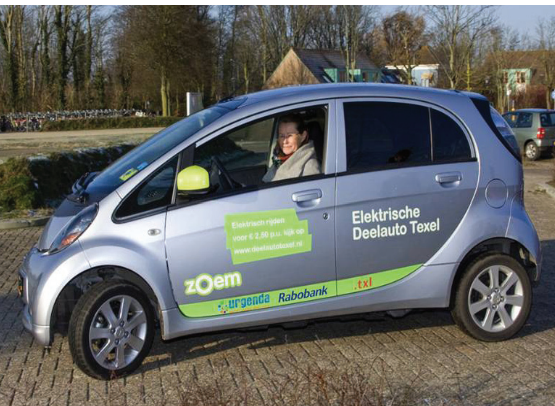
Burgemeester van Texel in elektrische deelauto.

Ook hielp Urgenda in 2012 koplopers op het gebied van duurzame mobiliteit verder op weg, zoals Hugohopper, buurtbus in Heerhugowaard gereden door vrijwilligers, Flex Overschie (in 2011 1ste prijs van ministerie I&M voor meest duurzame mobiliteit project van Nederland).