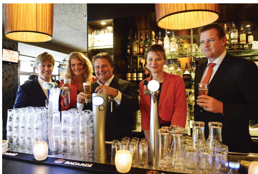
Start verduurzaming kroegen door Heineken

Een hoogtepunt tijdens de editie 2012 was het 'Low Car Diet', dat Urgenda organiseerde samen met de NS. Tien topbestuurders van onder meer Desso, Microsoft, Regus, ABN-Amro, ASN, Strukton en Nuon leverden hun autosleutels in en reisden tien dagen lang met onder andere openbaar vervoer, fiets en deelauto. Naar schatting bespaarden deze topmannen alleen al door het gebruik van de trein in tien dagen ca. 1.500 KG CO2.