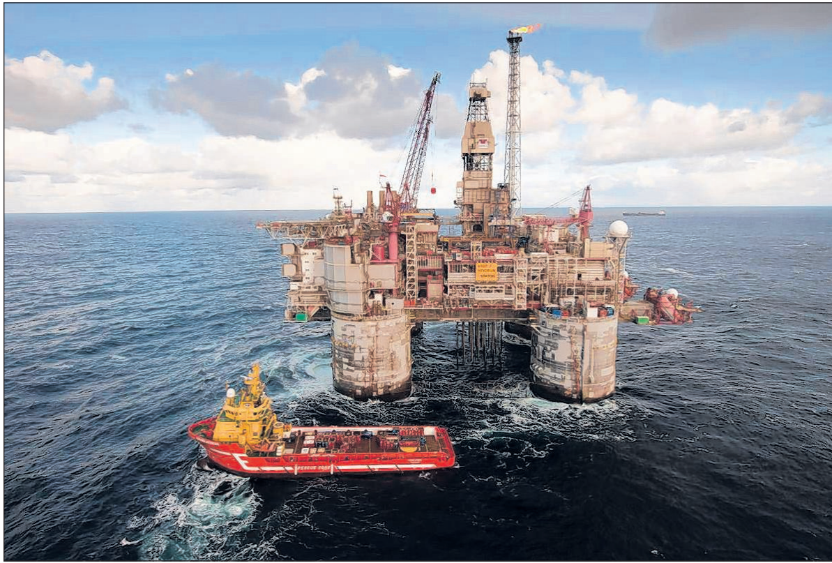
'Bedrijven van de oude fossiele economie bieden zo lang mogelijk weerstand tegen verduurzaming'.

De aanjager lijkt tot op heden niet de landelijke politiek te zijn. Gaat u maar rustig slapen, lijkt de boodschap. De urgentie lijkt niet doorgedrongen te zijn bij de grote partijen. Kunnen bedrijven dan de motor zijn? Zij hebben een cruciale rol. Er zijn al veel bedrijven die voor een duurzame koers hebben gekozen. De multinationals die hun nek uitsteken, vragen echter wel van de overheid om te zorgen dat normen aangescherpt worden. Dan kunnen achterblijvers namelijk niet profiteren van het feit dat ze viezer en goedkoper zijn. Vervuilend produceren moet niet langer lonend zijn. Als de overheid kijkend naar de meest vooruitstrevende bedrijven, de eisen en normen opschroeft, zal een hele sector uitgedaagd worden betere oplossingen te vinden. Maar als de overheid niet voldoende beweegt, gaan de bedrijven dan in moeilijke tijden toch de omslag maken? Aan de ene kant wel, want ze zullen wel moeten, met steeds schaarsere grondstoffen en